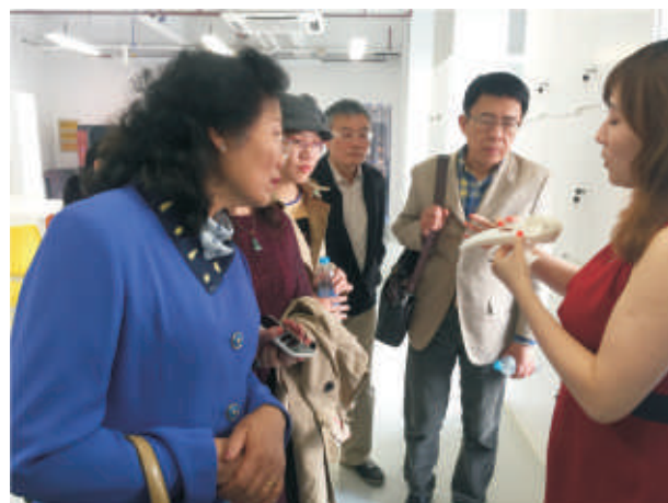
学长们在听取3D打印过程介绍。

载过。对于都是上世纪90年代商品房的紫荆社区来说，这个问题也同样困扰着业主、物业和居委会。